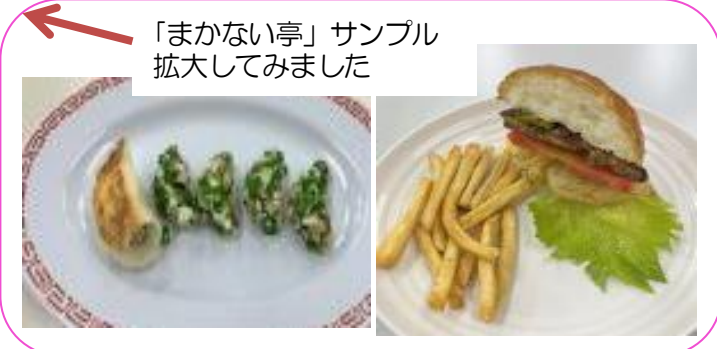
「まかない亭」サンプル 拡大してみました