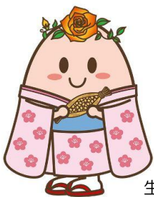
生活クラブ茨城のご当地ハグみちゃん