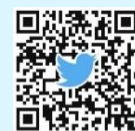
生活クラブ茨城 X (旧Twitter)