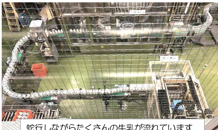
蛇行しながらたくさんの牛乳が流れています