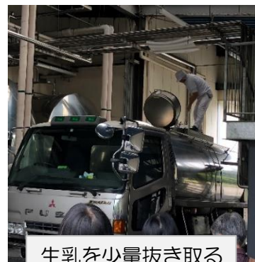
生乳を少量抜き取る

21件の酪農家から牛乳が集まります。 工場に運ばれた生乳は混ぜて少量取り出しすぐに微生物検査に出します。検査時間は約15分。 十何種類もの検査項目があります。 自前の洗瓶機もあります。 72度15秒殺菌、充填、打栓と様々な工程を機械やロボットで行います。 生産量は2000年当時は1日50トン(約2700万本)。今は減って約1100万本分です。