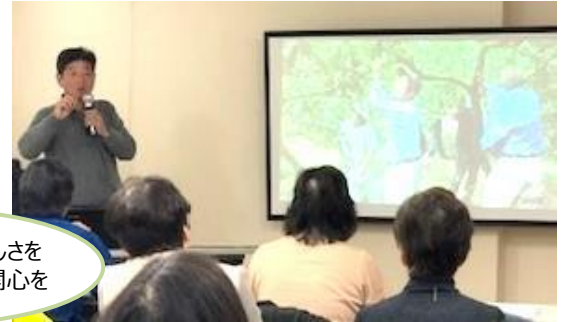
きばるの甘夏のおいしさを 糸口として、水俣に関心を

1/15、熊本県水俣市の甘夏生産者「きばる」との交流会を開きました。 水俣病の被害により海から陸へ上がることを余儀なくされた漁師と 支援に駆けつけた人々の共同作業により結成されました。 「被害者が加害者にならない」という思いから農業に頼らず、皮まで 安心して食べられる柑橘づくりを目指しています。