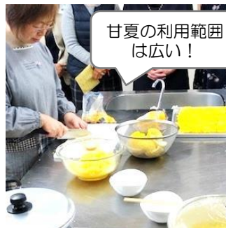
甘夏の利用範囲 は広い!

大好きな甘夏みかんのことが知りたかったので参加。 安全な甘夏みかんを作ることがどんなに大変なのか、とても 愛情を持って作られていることがわかりました。“知らないこと” がとても怖いことだと思いました。 消費者が賢くならないといけないと改めて思いました。 (S.Uさん)