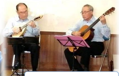
マンドリン演奏「アクアプレットロ」