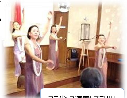
フラダンス演舞「ブラリリ」

多くの組合員の参加協力によって、各ブースでも来場者との対話があり、消費材の展示販売や、ランチメニューの調理販売もできました。「暖かで気持ちの良い新年のスタートを感じた」との感想を、複数人から受取りました。