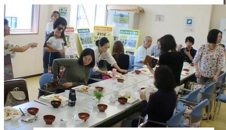
生産者を囲んでランチタイム