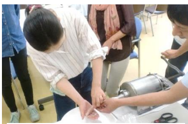
参加者全員でソーセージ作り

生産者の方々が種まきから収穫まで必要以上の農薬を使わないために、田植えの時に苗の間隔をあけて風通しをよくしたり、田んぼのあぜにハーブを植えて害虫対策をしていること。収穫後の保存や精米、粒の選別などに気を使い、私たち組合員に届くまで真心をこめて手間をかけてくださっているとはじめて知る事ができました。交流会後早速、夕飯にげんき米を炊きました。ご飯が炊き上がる甘い香り、ワクワクした気分になりました。出席された生産者の人柄や生産への真摯な考えを思い出しながらいただきました。