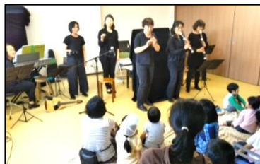
演奏と朗読の会。みんなも一緒に歌います