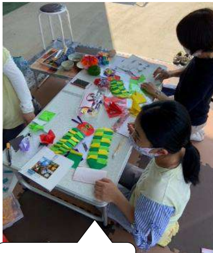
はらぺこあおむし 作成中！