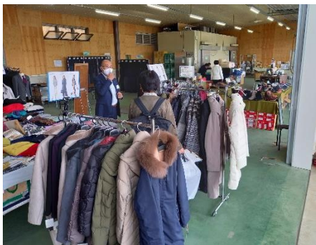
倉庫をすべて使いました。配達関連用具はすべてトラックなどの中に。職員とはあもにいのみなさん、倉庫内の準備と片付けありがとうございました。