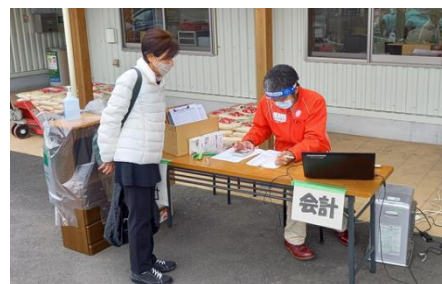
会計も今回は外です。雨が降らなくてよかったです。