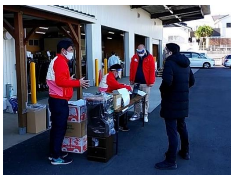
組合員はスタッフとしての参加ができず、受付も職員で。