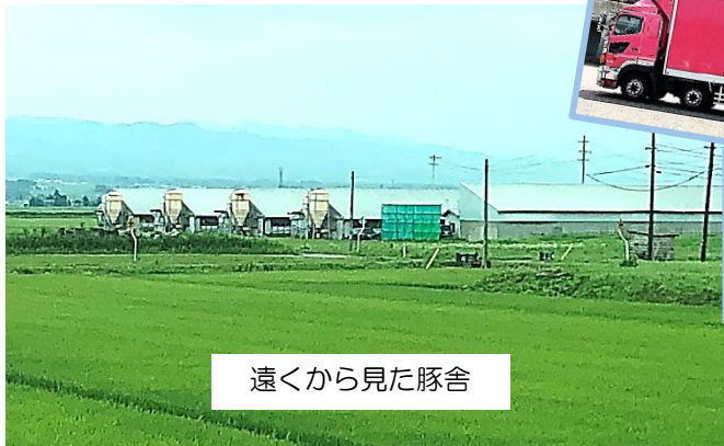
遠くから見た豚舎