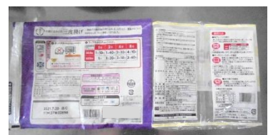
左：市販 右：生活クラブ