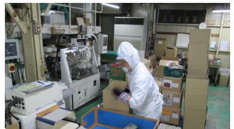
③一定時間冷ました後、大きな機械で袋詰めし、人の手・目で確認して箱詰めしていました。