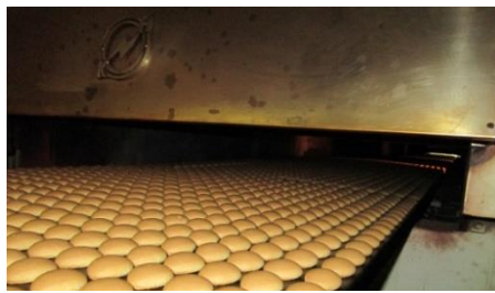
②流れていく間にだんだん焼きあがってぶっくりなりました。