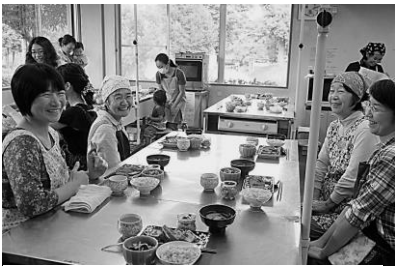
出来上がり!いただきまーす

また、せっけん使いの上手なスタッフもいますので、環境にやさしい生活をしたいと思っっている方もぜひどうぞ。スタッフ、アイデアも大募集!!