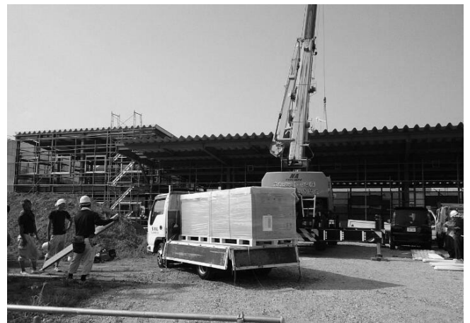
7月30日現在、屋根や窓枠もできました。