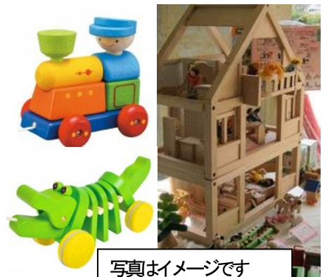
写真はいメージです

なお、急遽、生産者の都合でオーダーシャツのモノクロームの展示会参加は中止となりました。