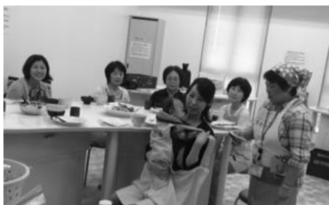
ズッキーニとトマトの味噌汁が色鮮やかで美味しく大好評でした!

つくばみらいではお豆腐を使ったちっちゃなちっちゃなミニクッキングをしました。 新しいコミュニティセンターの調理室で、楽しかったし美味しかったですね～。 みんな参加してくださいね。 お住いのまちでなくても参加できますので来てくださいね。 スタッフ一同、お会いできること楽しみにしています!! 印鑑を忘れずに～。お土産のドリンクも用意して待ってまあ～す!