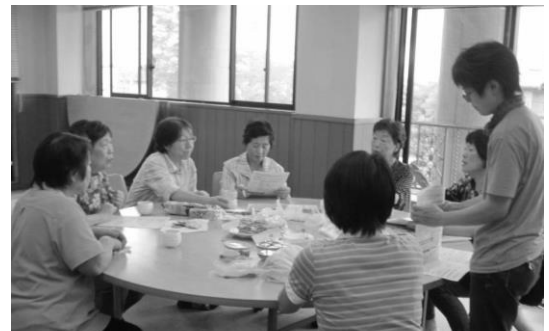
7月9日の利根が初っ端、10～16時までに40名の組合員が来ました!

先月号でお知らせしましたが七夕集会開催しています。 先日利根におじゃましてきました。 以前にもおじゃましたのですが組合員歴長い方ともお会い できて色々なお話ができてとても元気もらえましたあ～。 また元気もらえるかなあ～、またおしゃべりできるかなあ～ と思っていた通り沢山の方にお会いできました(*^_^*) わざわざ印鑑押しに行くって本当に面倒だと思います。 ですが、お会いしてどんなことでもいいのでお話ししたいん です。話すことって、とっても大事なことだと思うので。 利根の皆様どうもありがとうございました。