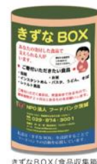
きずなBOX(食品収集箱)

https://sites.google.com/site/fbibaraki/