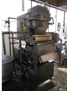
おからと豆乳に分ける