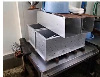
豆乳とにがりを混ぜ、入れて固める型(木綿豆腐)