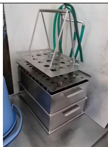
豆乳を型に入れ、にがりをさつと混ぜる固める型(きぬ豆腐)