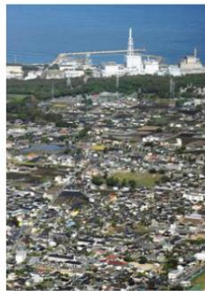
東海第二原発(写真上)と東海村の市街地 2017年2月1日