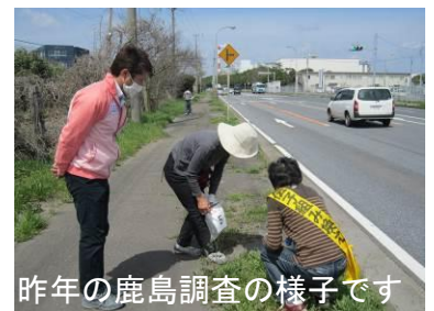
昨年の鹿島調査の様子です