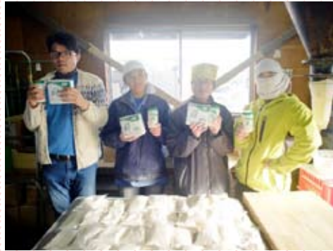
「NOP法人ありのま、就労継続支援B型事業所あるば」に製造の一部を委託しています