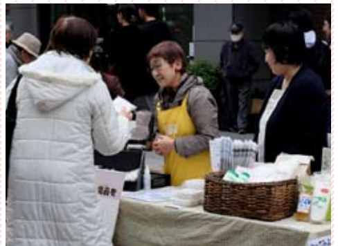
会員は、廃油回収、せっけんのPR、環境学習の講師と幅広く活動しています