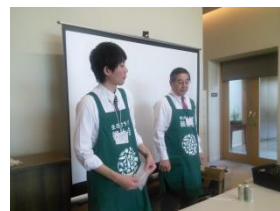
生産者のわかりやすいお話と実験で楽しい時間でした

いました。その後、こねこねマイせっけんクリスマスツリーを一人一人作りました。仕上げにティートゥリーやレモンアロマを数滴！お部屋はすっかりさわやかな香りでつまれ、まだ生活クラブに加入していないお友達と一緒に参加してくれた組合員さんも、優雅な一時を満喫しました。