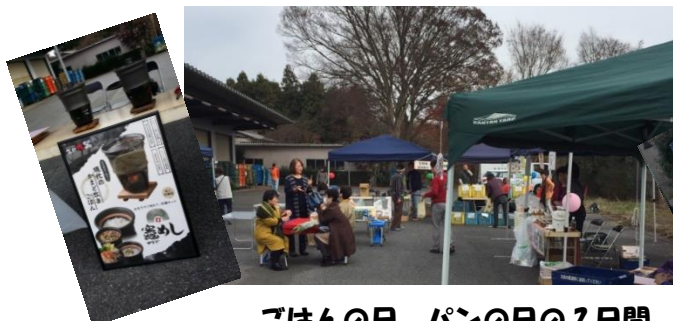
ごはんの日、パンの日の2日間